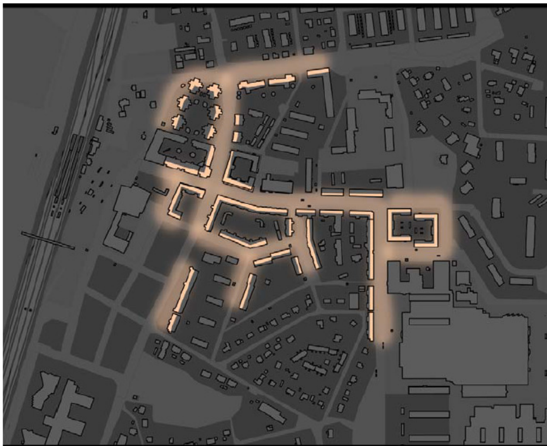
Bostäder i centrala Väsbys som är lokaliserade så att de har en funktion (influensområde) som "ögon" mot gatan.

Möjligheten att röra sig fritt i stadsstrukturen, dvs att ha tillgång till många valmöjligheter i ett finmaskigt gatunät, är tillsammans med orienterbarhet ledord i skapande av upplevd trygghet. Kunskap kring belysning har utvecklats mycket. Starka lampor och högmastbelysning som skapar skarpa kontraster har ersatts av flera, men svagare och lågt sittande armaturer, som ger jämnare belysning och möjlighet att urskilja på längre avstånd. Förutsättningarna att känna igen och att läsa av ansiktsuttryck är starkt påverkande på trygghetsupplevelsen. Moderna ljuskällor är bra på jämn och naturlig färgåtergivning till skillnad från det gula färgförvrängande skenet från högtrycksnatrium som vi länge tvingats vänja oss vid.