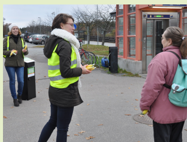
Dialog vid Väsby station.