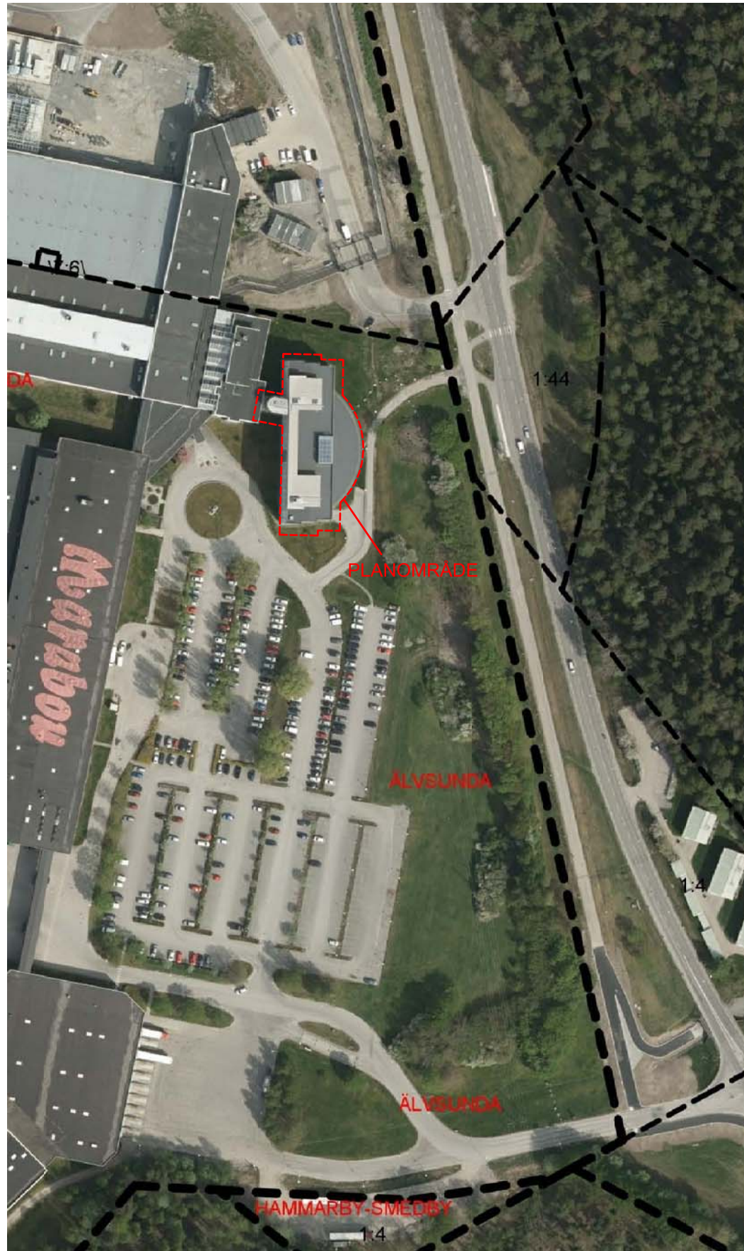
ORIENTERINGSBILD UNGEFÄRLIG SKALA 1:1000 i A1 (1:2000 i A3)