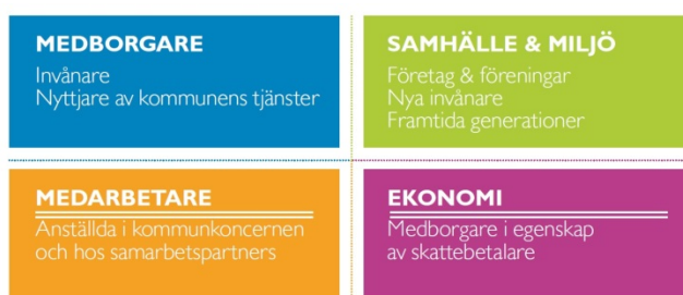
Fig 1. Kommunfullmäktiges perspektiv (styrkort)

Arbetet med jämställdhet ska föras med de nationella jämställdhetsmålen som vägledande dokument. Jämställdhetsintegrering är det huvudsakliga medlet för att nå de jämställdhetspolitiska målen, och ska beaktas i alla kommunfullmäktiges perspektiv (se fig 1). Med jämställdhetsintegrering menas ett systematiskt arbete med (om)organisering, förbättring, utveckling och utvärdering av beslutsprocesser, så att ett jämställdhetsperspektiv införlivas i allt kommunalt beslutsfattande, på alla nivåer och i alla steg av processen, av de aktörer som normalt sett deltar i beslutsfattandet.