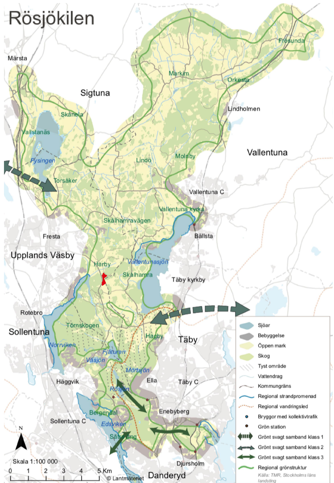
Karta 1. Rösjökilen består av ett sammanhängande natur- och odlingslandskap som sträcker sig genom sex norrortskommuner, från Danderyd i söder via Sollentuna, Täby och Upplands Väsby till Sigtuna i norr. Kilen karaktäriseras av barrskogar i söder och fornlämningsrika kulturbygder i norr. Kilen har ett varierat utbud av upplevelsevärden och är viktig för den tätortsnära rekreationen i flera kommuner. Utredningsområdet markerat i rött ligger i gränslandet mellan skogs och odlingsbygderna.