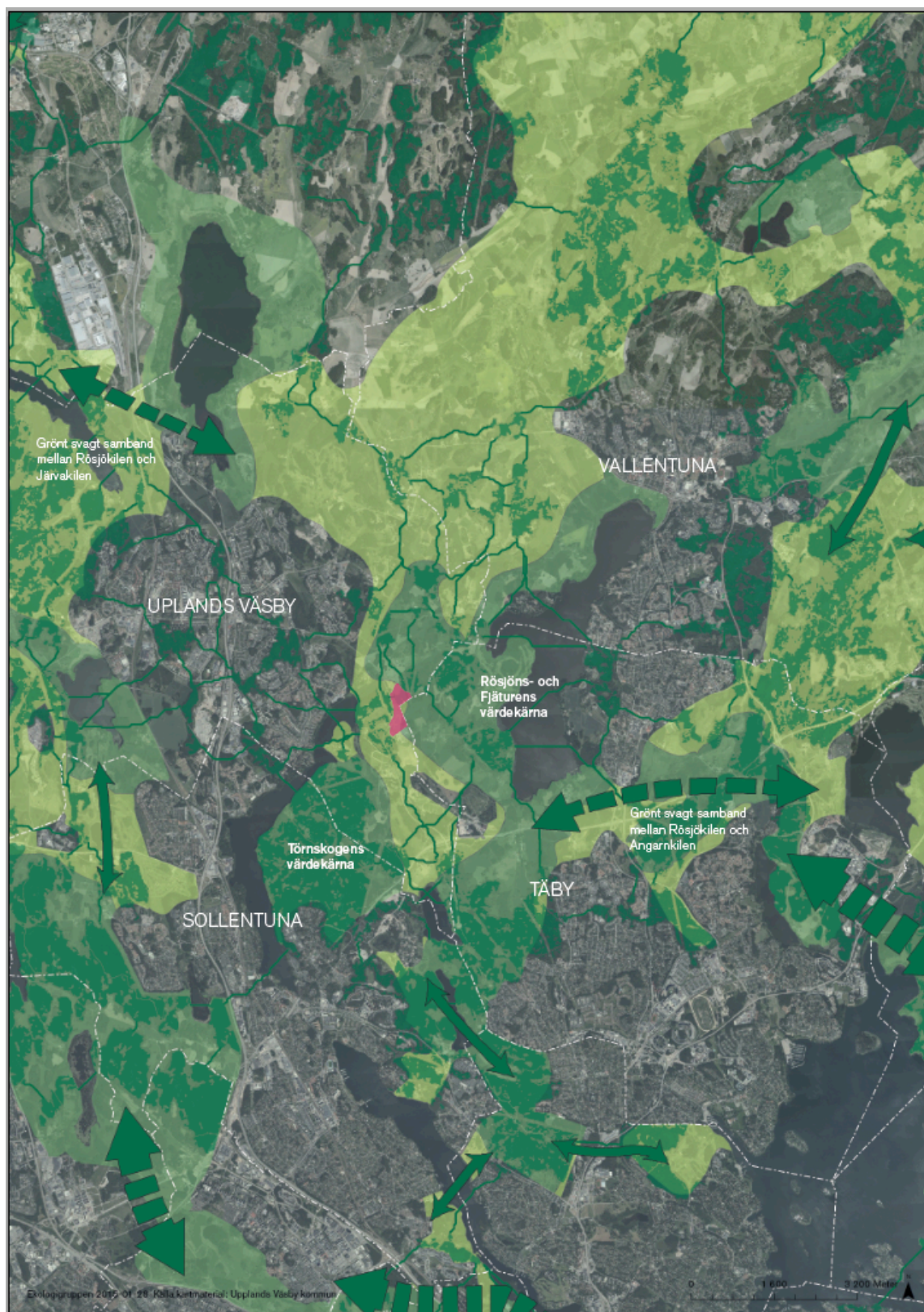
Karta 4. Den här kartan har ungefär samma utsnitt som karta 1. Kartan visar ett utsnitt av en regional nätverksanalys för barrskogslevande arter- De grönmarkerade klustrade områdena inom kilarna visar var de värdefulla barrskogarna finns. Värdeområdena sammanfaller till stor del med Rösjökilens värdekärnor. Planområdet påverkar inga så kallade primära eller sekundära spridningssamband.