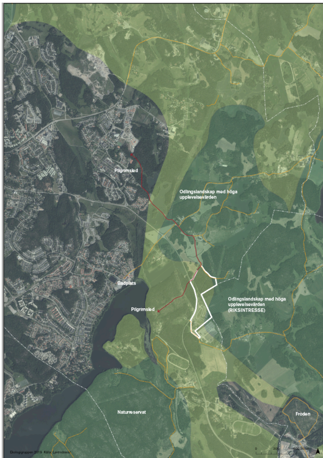
Karta 2. En mer inzoomad bild av Rösjökilen på flygfoto, där de grönmarkerade områdena i öster motsvarar kilen. Den röda sträckningen visar var Svenska Kyrkans pilgrimsled sträcker sig. De orange-markerade lederna visar på stigar och mindre vägar som bedöms användas för rekreation och friluftslivet i den här delen av kilen. Det mörkgröna i kartan visar på Rösjökilens värdekärnor och den ljusare gröna färgen på så kallade kilområden som har som främsta funktion att binda ihop värdekärnorna. Utredningsområdet har här markerats i heldragen vit linje och kommungränserna i